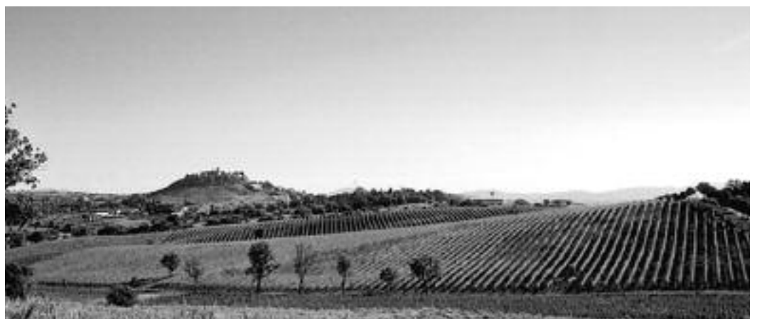
Blick von Poggio Maestrino

Geschmack: dank seiner vielschichtigen, umhüllenden Struktur opulent; akzentuierte Würze in harmonischer Balance mit den beachtlichen Alkohol- und Säurekomponenten. Ein stoffiger Wein mit adäquatem Tanningerüst von beachtlicher Länge, der um das Jahr 2005 seine volle Potenz entwickeln wird und aufgrund der partikulären Charakteristiken seine besten Eigenschaften über mehr als zehn Jahre nach der Ernte in voller Ausdrucksstärke zu bewahren vermag.