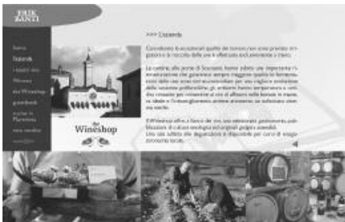
Einige Sektionen der neuen Webseite

schen Produkten wird eine Datenbank mit zahlreichen kulinarischen Vorschlägen dediziert, die, anfänglich auf die typischen Rezepte der Maremma konzentriert, in der Folge die regionalen Grenzen überschreiten und die besten Gerichte der italienischen Küche präsentieren werden.