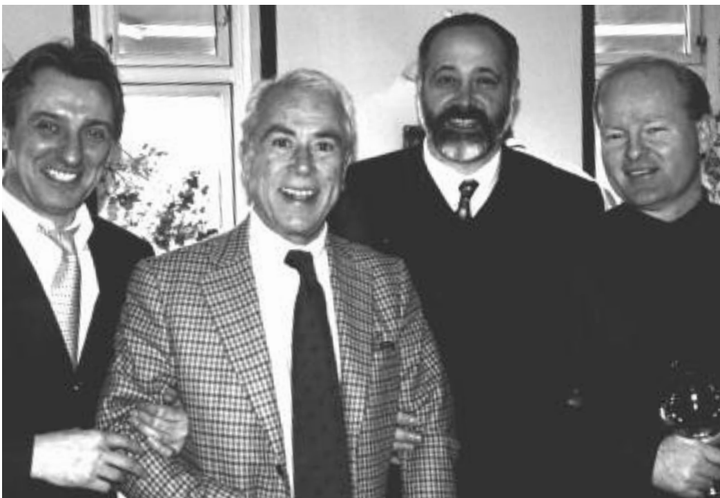
Die Gruppe von „La Vela“