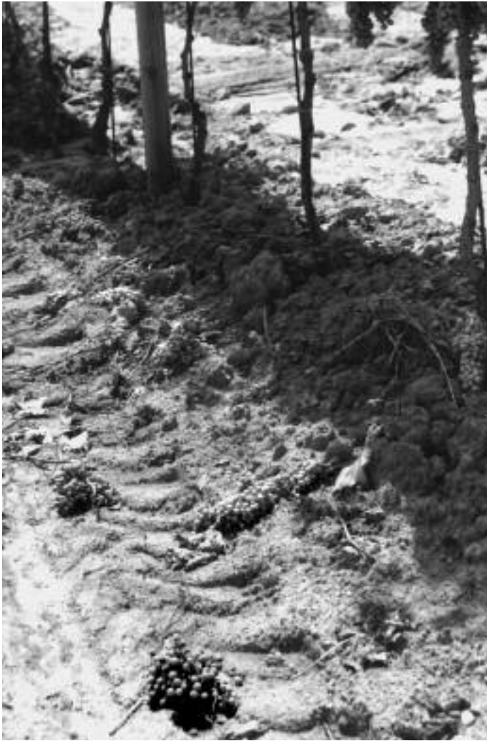
oben: Poggio Maestrino nach der "Grünelese". rechts: die Weinlese

D ie Arbeiten im Weinberg waren tadellos ausgeführt worden.