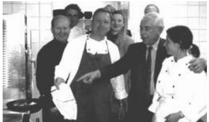
In der Küche vom „Paustian“

Gläser mit... gutem italienischen Wein füllen.